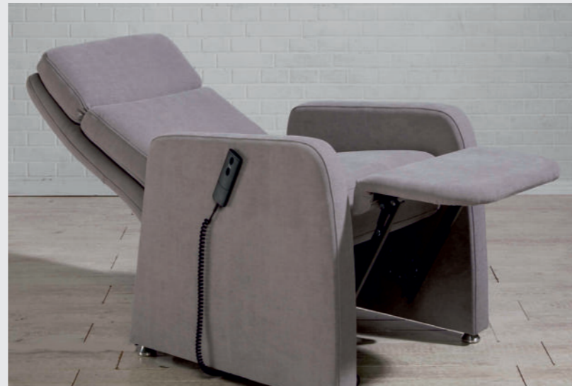
TV-Sessel Relax EASY in Relaxposition