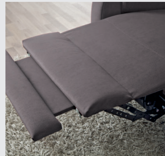
Komfortable Verlängerung der Fußablage bei den Schwerlastsesseln Relax COMFORT und Relax PLUS