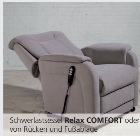
Schwerlastsessel Relax COMFORT oder Relax PLUS mit M2 – separates Verstellen von Rücken und Fußablage