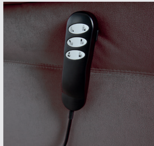
Leicht bedienbare Handschalter