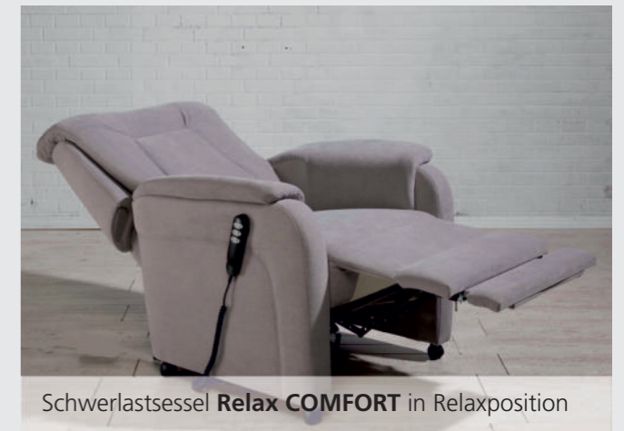
Schwerlastsessel Relax COMFORT in Relaxposition