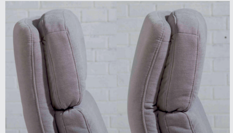
Serienmäßige Kopfteilverstellung bei TV-Sessel Relax EASY