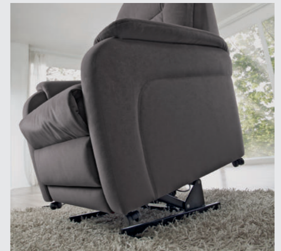
Sicheres Aufstehen mit Hilfe der stabilen und immer motorischen Aufstehhilfe