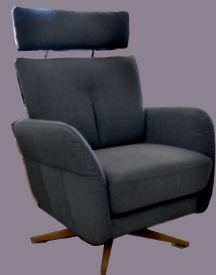
Drehsessel EDDY in 2 Sitzhöhen, 4 Sitzhärten und 4 Drehfußvarianten

TV-Sessel-System MODULUS PLUS 9000 ergonomisch zertifiziert und massgeschneidert konfigurierbar mit 4 Rücken- und 4 Armlehn-optiken in 2 Sitzhöhen und 4 Drehfußoptiken